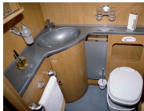
Wie zu Hause: Das große Heckbad lässt fast keine Wünsche offen und bietet den Insassen sogar eine Haushaltsduschkabine.