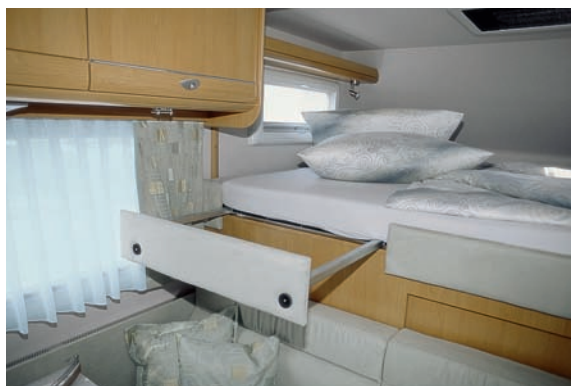
Elegante Lösungen: Im Eingangsbereich sind die schicke Glasvitrine und der Flachbildschirm untergebracht (links). Das Alkovenbett lässt sich verbreitern (oben).