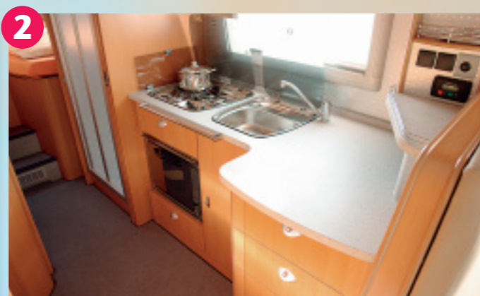
2 Richtig praktisch: Die gediegen gestaltete L-Küche bietet nicht nur eine komplette Einrichtung mit viel Arbeits- und Ablagefläche, sondern auch reichlich Stauraum für Geschirr und Vorräte.