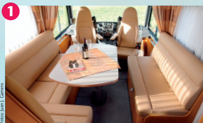
1 Richtig komfortabel: In der großzügig dimensionierten Sitzgruppe mit L- und Längssitzbank finden einschließlich der drehbaren Frontsitze auf gleicher Höhe bis zu sieben Personen bequem Platz.