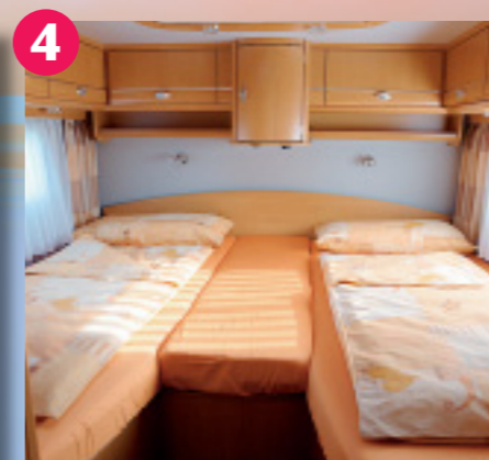
4 Richtig bequem: Das Schlafzimmer trumpft mit längs eingebauten Einzelbetten auf. Dank eines Mittelteils lässt sich auch gemeinsam kuscheln.